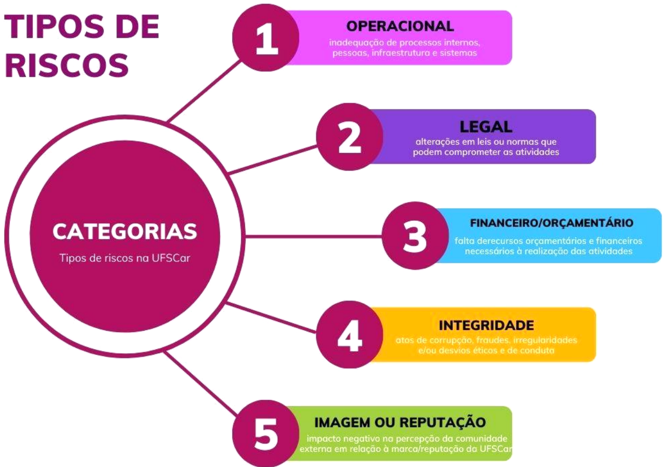
Figura 1 - Categorias ou tipos de riscos existentes na UFSCar